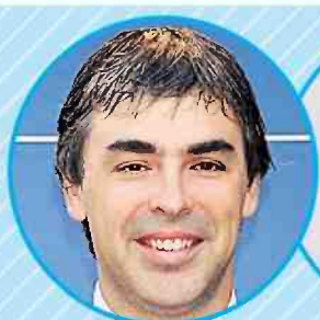
לארי פייג' וסרגיי ברין מייסדי גוגל