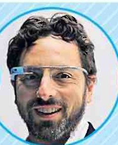
מארק צוקרברג מייסד פייסבוק