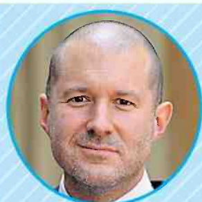
ג'ונתן אייב המעצב הראשי של אפל